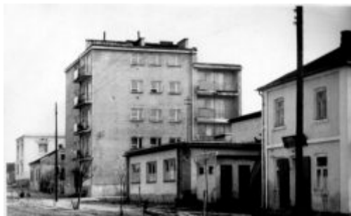
Kocki „wieżowiec” - obok Izba porodowa