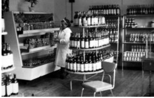
Sklepy spożywcze GS