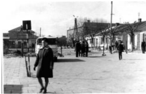
Rynek - strona zachodnia lata 60