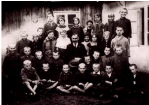
Uczniowie jednej z klas przedwojennej szkoły podstawowej