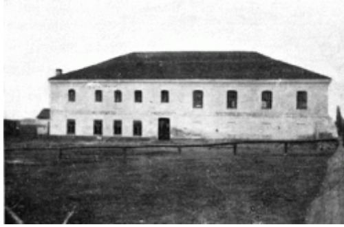
Synagoga żydowska (zniszczona przez Niemców w 1941 r.)