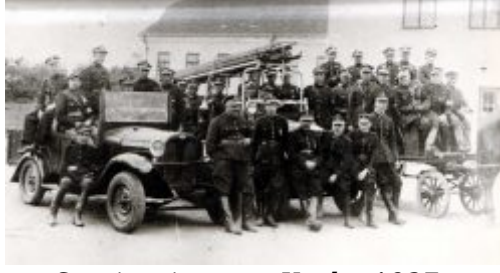
Straż pożarna w Kocku 1937r.