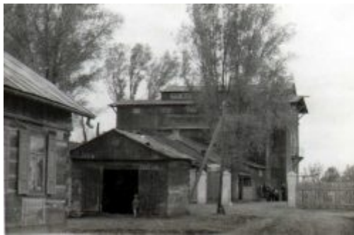
Młyn i kuźnia