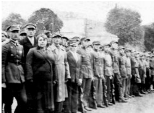
Święto Stowarzyszenia Strzeleckiego w Kocku