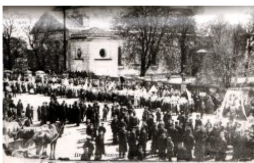
Uroczystości Bożego Ciała