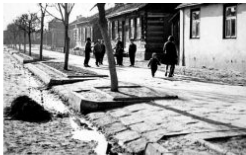
Ulica Wojska Polskiego