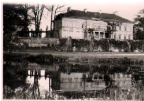
Widok na pałac od strony południowej