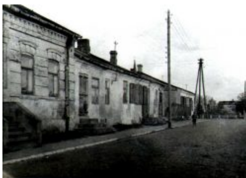
Obecna ulica 1 Maja (w głębi rynek)