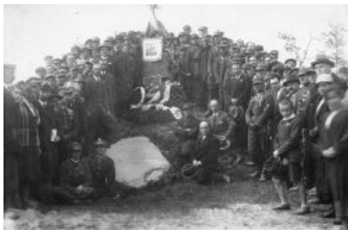
Uroczystość przy grobie Berka Joselewicza w rocznicę śmierci