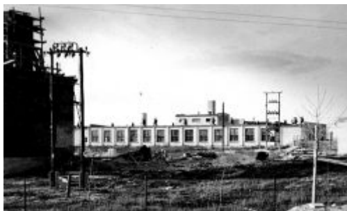
Zakład POM w Kocku