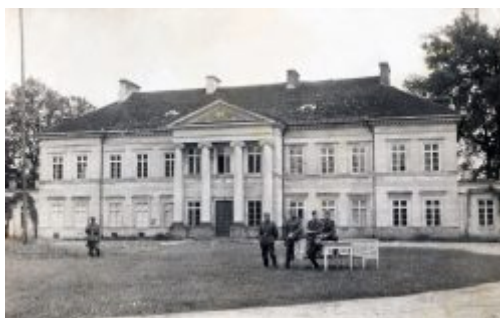
Pałac podczas II wojny jako siedziba władz okupacyjnych