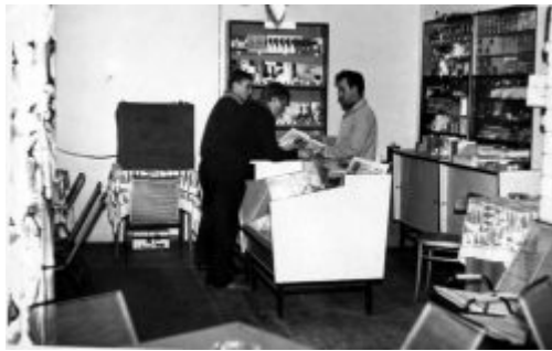
Klub Prasy i Książki „RUCH”