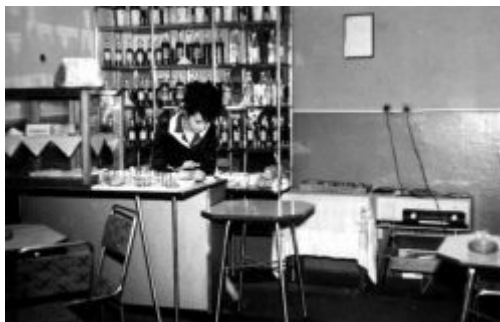
Kawiarnia w Kocku