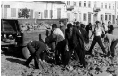
Prace porządkowe na rynku