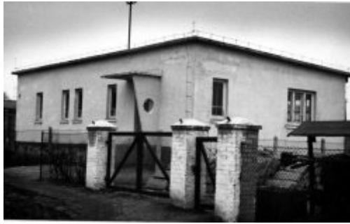
Budynek łaźni miejskiej