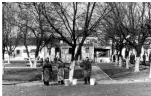
Wiosenne porządki na skwerze