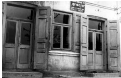
Spółdzielnia produkcyjna „GRACJA”