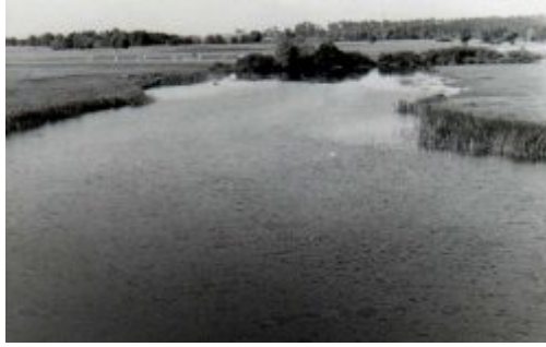
Tyśmienica widziana z mostu