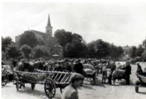
Targi na kockim rynku