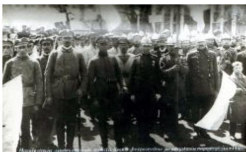
Manifestacja na rynku społeczności Kocka bezpośrednio po odzyskaniu niepodległości