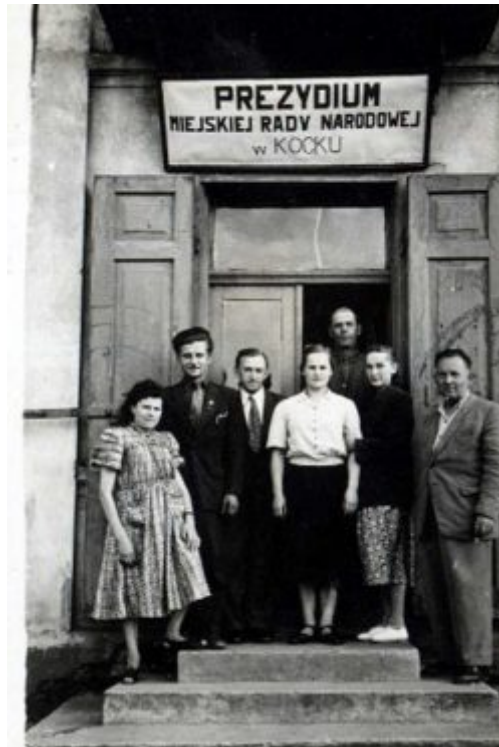
Prezydium Miejskiej Rady Narodowej - pod koniec lat 40