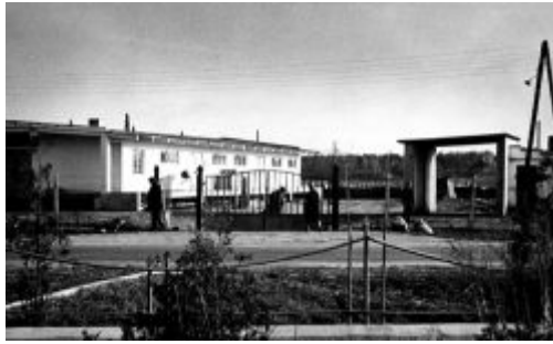
Baza magazynowa GS