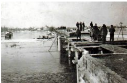
Budowa mostu na Tyśmienicy