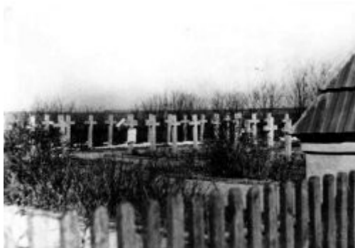
Cmentarz Wojenny w Kocku rok 1952