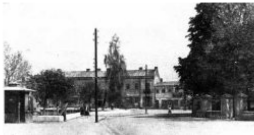
Rynek w Kocku