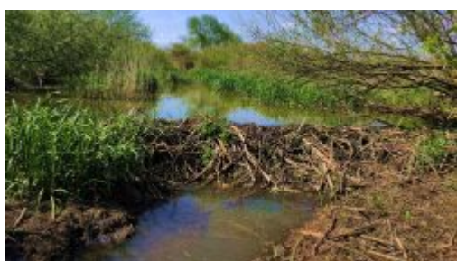
Żeremie bobrów przy Tyśmienicy