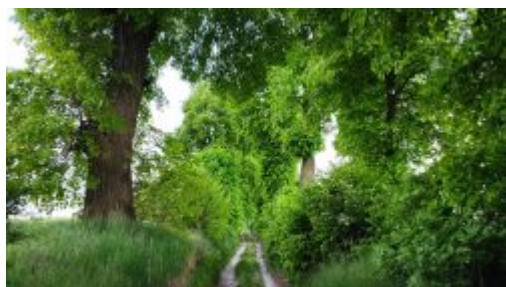
Wąwóz w okolicy Kocka