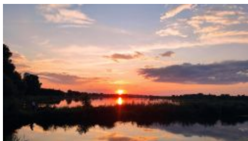
Zachód słońca nad Czarną i stawem „Papiernia” w Kocku