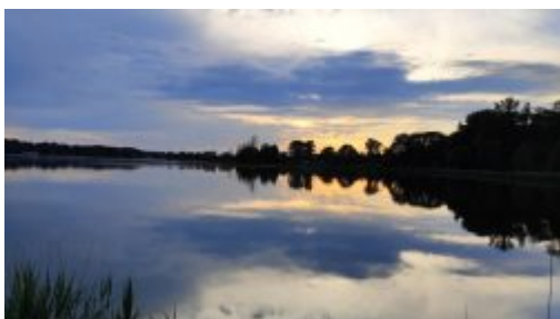
Staw „Cegielnia” w Annopolu