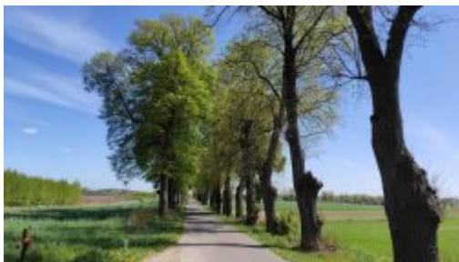
Aleja lipowa do Ruskiej Wsi