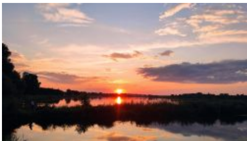
Zachód słońca nad Czarną i stawem „Papiernia” w Kocku