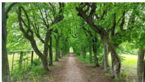
Park w Kocku, aleja grabowa