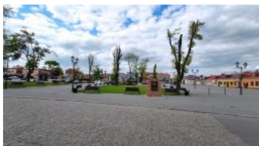
Pomnik na rynku w Kocku