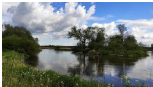
Wieprz w okolicy Zakalewa