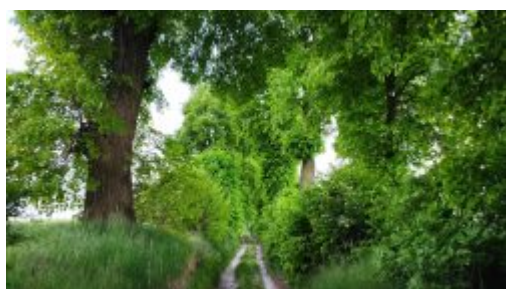
Wąwóz w okolicy Kocka