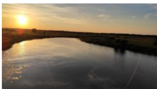
Zbiornik „Kęsy” w Bożniewicach - Fot. Jurek Wawerek