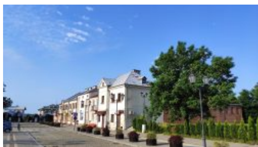
Pierzeja zachodnia rynku w Kocku