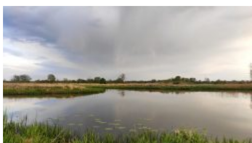
Starorzecze Wieprza w Ruskiej Wsi