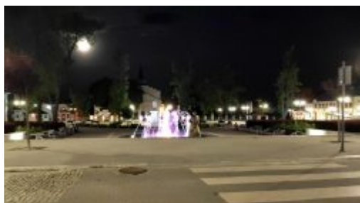
Rynek w Kocku nocą