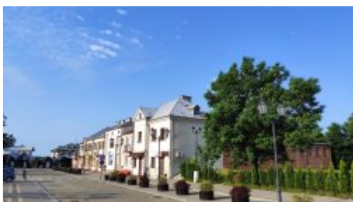
Pierzeja zachodnia rynku w Kocku