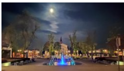
Rynek w Kocku nocą