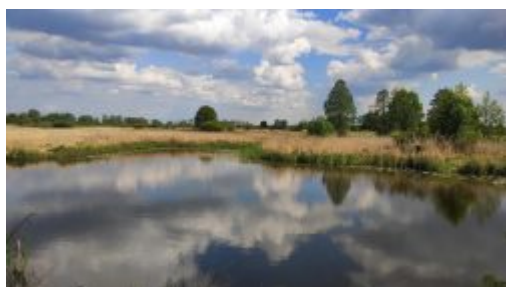
Starorzecze Wieprza