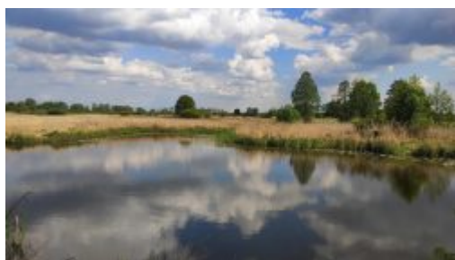
Starorzecze Wieprza