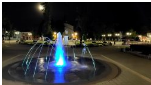
Fontanna – Fot. Jurek Wawerek