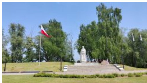
Rynek w Kocku nocą – Fot. Jurek Wawerek Pomnik Gen. Franciszka Kleeberga 0 Fot. Jurek Wawerek