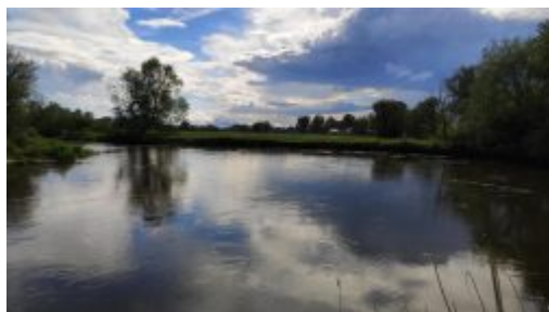
Wieprz w okolicach Bożniewic