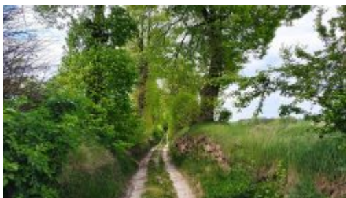
Jeden z wąwozów w okolicy Kocka