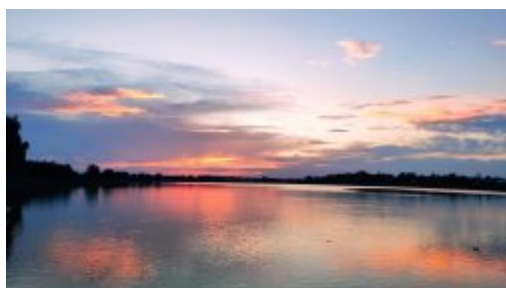
Staw „Papiernia” w Kocku