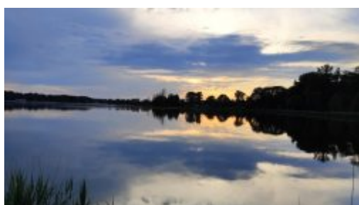
Staw „Cegielnia” w Annopolu