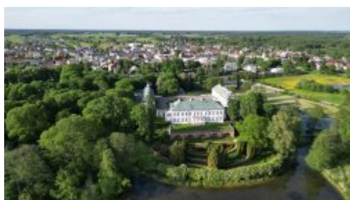
Kock z drona