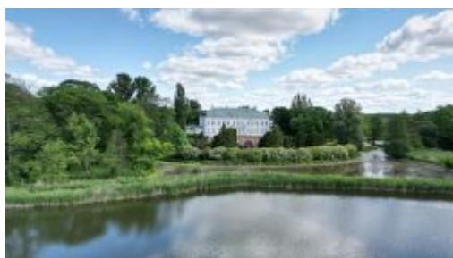
Pałac Jabłonowskich w Kocku - widok z drona