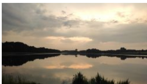
Staw w Talczyń