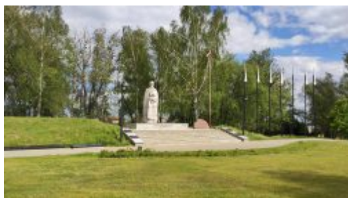
Pomnik Generała Franciszka Kleeberga