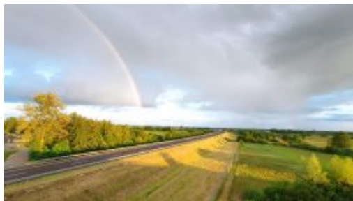
Widok z wiaduktu nad trasą S-19