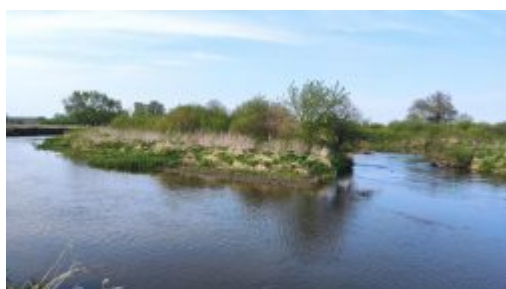
Wyspa na Wieprzu w Bożniewicach