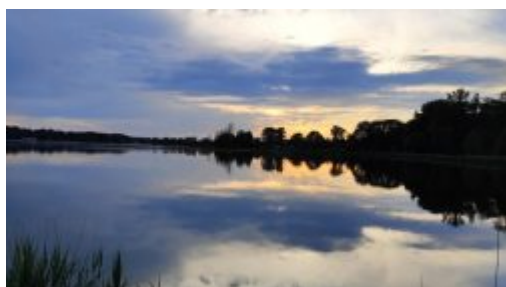
Staw „Cegielnia” w Annopolu