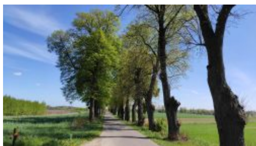
Aleja lipowa do Ruskiej Wsi