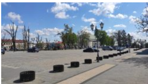
Rynek w Kocku