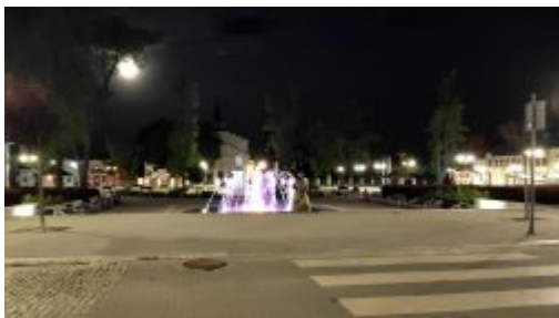
Rynek w Kocku nocą