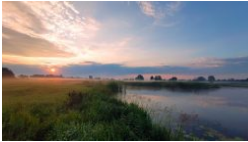
Szewczak o wschodzie Słońca