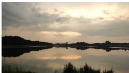
Staw w Talczyńskie