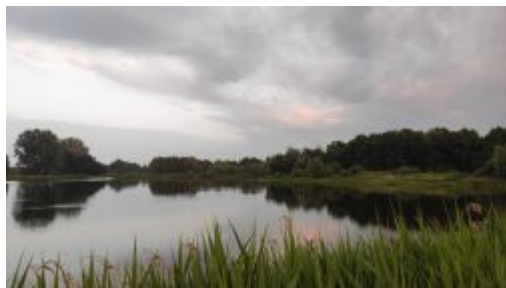
Staw w Talczyńskie