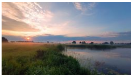
Szewczak o wschodzie Słońca