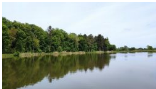
„Podgóry” w Kocku