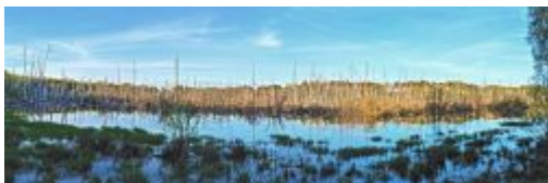
Uroczysko w okolicy Talczyzna