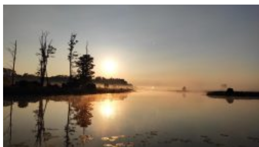
Zbiornik „Kęsym”, Bożniewice