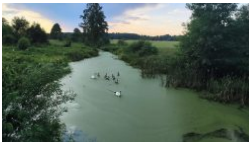
Rodzina łabędzi, Okolice Ruskiej Wsi