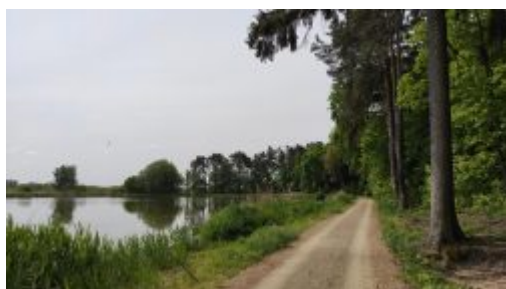
„Podgóry”, Trasa rowerowa nad stawami