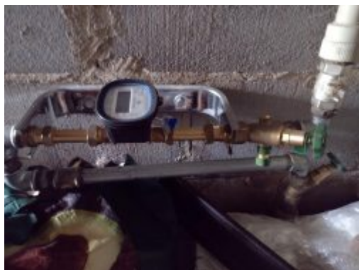
Zestaw wodomierza ultradźwiękowego.

2. Modernizacja systemu sterowania na SUW w Talczyńcu – wydatki wyniosły 36.900,00 zł