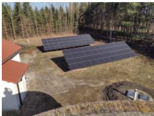
Fotowoltaika przy SUW w Białobrzegach

W 2022 r. zostanie dokończona wymiana wodomierzy i nastąpi uruchomienie serwisu internetowego.