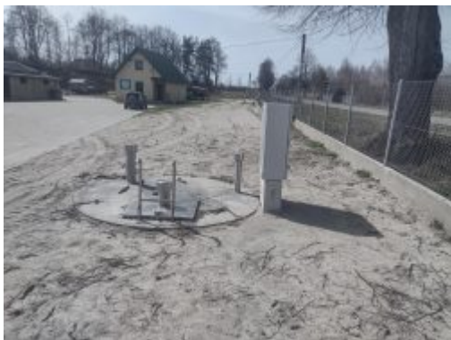
Tłocznia ścieków przy ul. B. Joselewicza