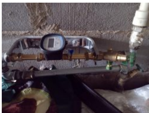
Zestaw wodomierza ultradźwiękowego.

2. Modernizacja systemu sterowania na SUW w Talczyńcu - wydatki wyniosły 36.900,00 zł